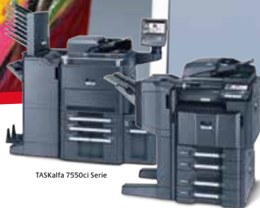
TASKalfa 7550ci Serie